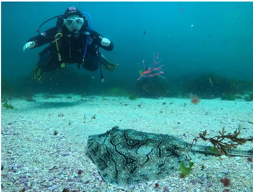
Figura 1. Momento de una inmersión durante un censo visual.

Para la aplicación de modelos marcaje recaptura se llevaron a cabo diferentes salidas de campo para realizar censos visuales (Fig. 1) en los que se marcaron los ejemplares observados para una identificación a nivel de individuo. Los censos visuales se realizaron cubriendo diferentes momentos del año para estudiar la estacional de la dinámica poblacional.