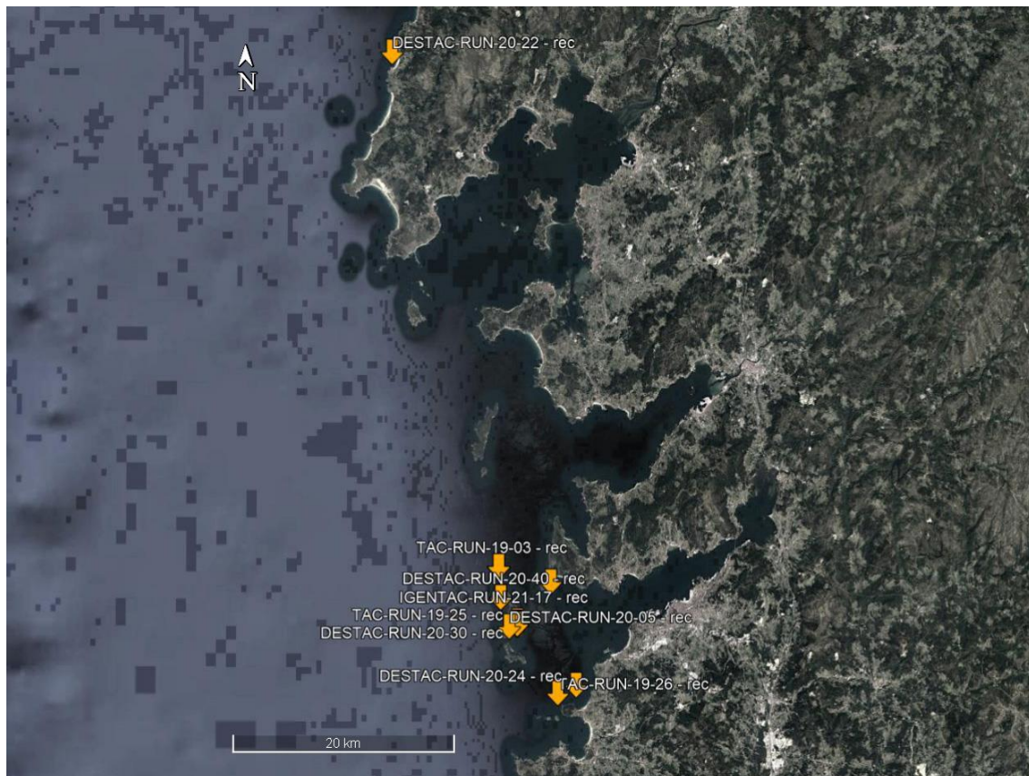
Figura 3. Localización de las recapturas de individuos de Raja undulata marcados en el archipiélago de las Islas Cíes en el Parque Nacional Marítimo Terrestre das Illas Atlánticas de Galicia.

Esta actividad supuso una oportunidad para encontrar un punto de encuentro con investigadores internacionales. En concreto, el equipo investigador de iGENTAC fue invitado a participar en un taller, Movement behavior of fish and individual fitness in coastal habitats with spatially varying fishing pressures, organizado por Albert Fernández Chacón, investigador de la Universidad de Agder en Noruega (Fig. 4). En este taller se discutieron los principales resultados del proyecto y se plantearon futuras colaboraciones para darle continuidad al trabajo iniciado en el proyecto IGENTAC en la aplicación de estos modelos para el monitoreo de la población de elasmobranquios del parque nacional.