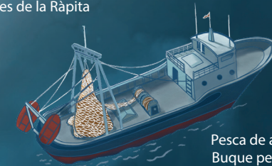
Pesca de arrastre Buque pesquero