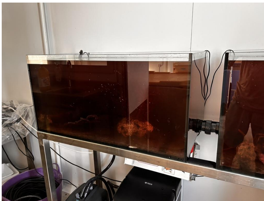
Fig. 2. Episodio de mortalidad de Paramuricea clavata

A pesar de que en todos los casos se intentó su recuperación, algunas colonias llegaron a deteriorarse durante su mantenimiento en las instalaciones de acuarios, produciendo la liberación de material orgánico que provocó la turbidez del agua y requirió la realización de cambios de agua (Fig. 2) Estos episodios no afectaron al resto de gorgonias mantenidas en los acuarios.